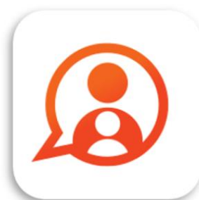
Konnect OuderApp Konnect B.V.

Toestemmingen kunnen achteraf worden gewijzigd onder het kopje overig . Door in dit overzicht te klikken op het kind kan u de toestemming wijzigen of invullen.